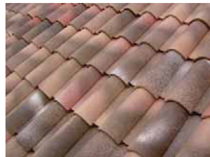
Plain Sud - Emporda

V tomto roku skupinu keramických strešných krytín určených pre modernú architektúru doplnil typ Auxoise - škridla vyrobená z mimoriadne kvalitnej suroviny, s vysokou precíznosťou spracovania. Vyznačuje sa vynikajúcou kvalitou povrchového prevedenia a jej sortiment dopln-