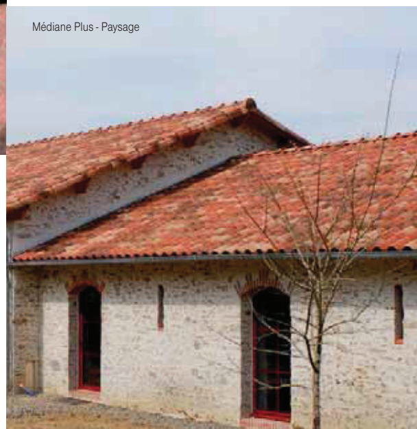
Médiane Plus - Paysage

ROVNAKO AKO V PREDCHÁDZAJÚCOM OBDOBÍ AJ V TOMTO ROKU SPOLOČNOSŤ VILLATESTA S.R.O. (MIMOCHODOM, TÁTO SPOLOČNOSŤ JE NAJVÝZNAMNEJŠÍM ARCHITEKTONICKÝM ZÁSTANCOM A AJ DODÁVATEĽOM PRÍMORSKEJ ARCHITEKTÚRY NA SLOVENSKU) PREDSTAVILA NA MEDZINÁRODNOM VELTRHU STAVEBNÍCTVA CONECO 2013 NAJNOVŠIE SVETOVÉ NOVINKY SPOMEDZI VYSOKOKVALITNÝCH KERAMICKÝCH STREŠNÝCH KRYTÍN.