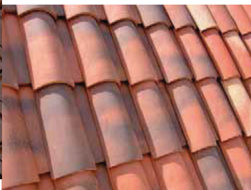
Plein Sud - Rouergue