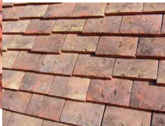
Plate Pressée 17x27 - Millésime

kov je kompatibilný s typom škridle Terroise. Jej dômyselné vypracovanie a dizajn umožňuje optické riešenie maloformátovej škridle vo veľkom formáte. Samozrejme, takéto šikovné riešenie má veľmi pozitívny vplyv na zníženie výslednej ceny strechy.